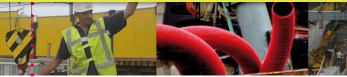
Ruland + Partner Architekten bna